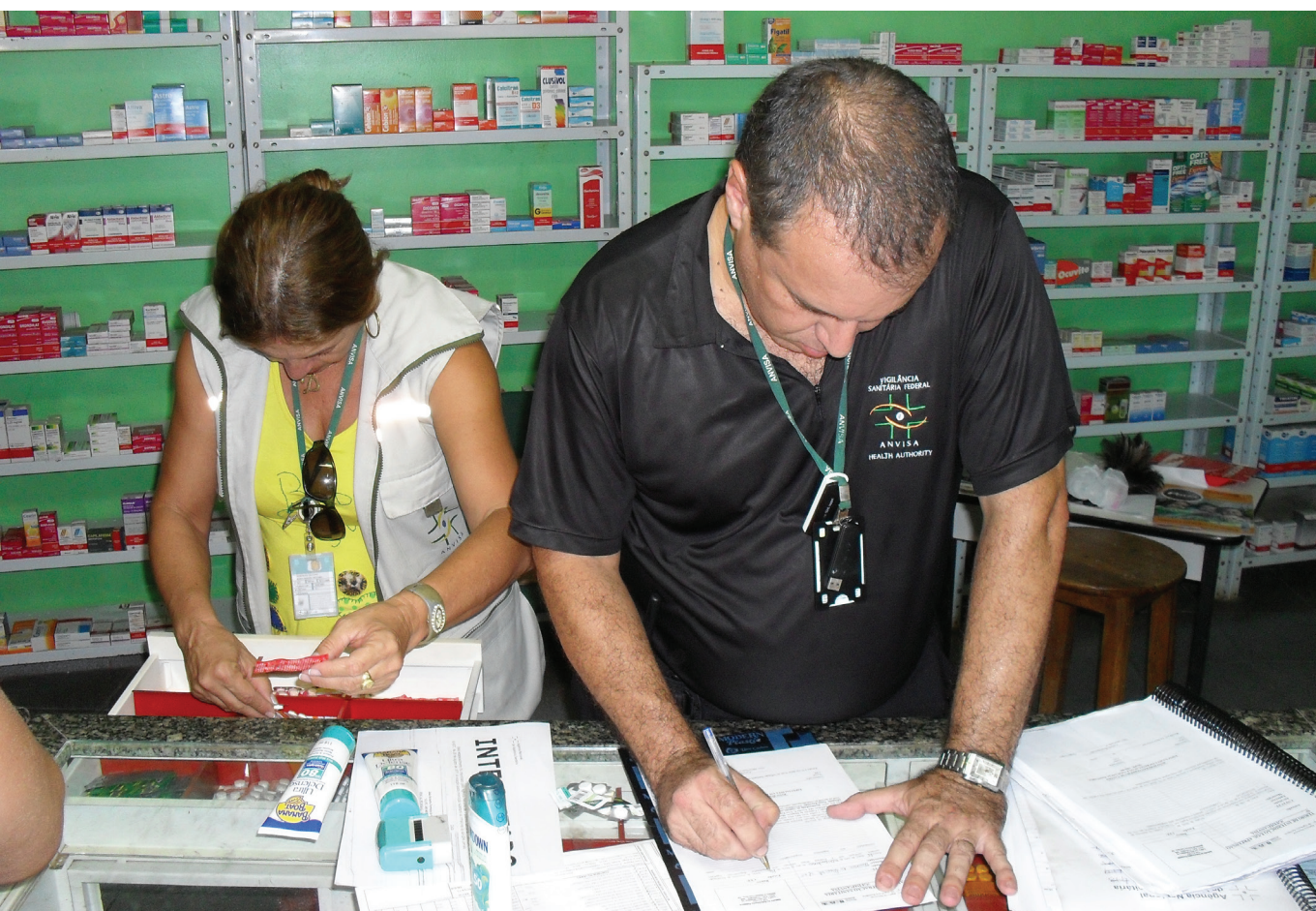
Fiscais interditam estabelecimento irregular