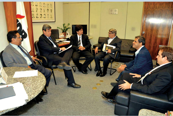
Parlamentares recebem lideranças farmacêuticas