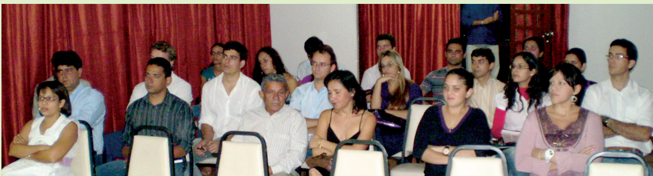
Farmacêuticos do interior marcaram presença em atividades do CRF-BA

Na programação da atividade, foram discutidos: “Atenção Farmacêutica e os Serviços Básicos de Saúde”; “Assistência Farmacêutica no SUS”; “Farmácia como Estabelecimento de Saúde” e o “Farmacêutico e os Serviços de Farmácia Hospitalar e Movimento dos Laboratórios de Análises Clínicas”.