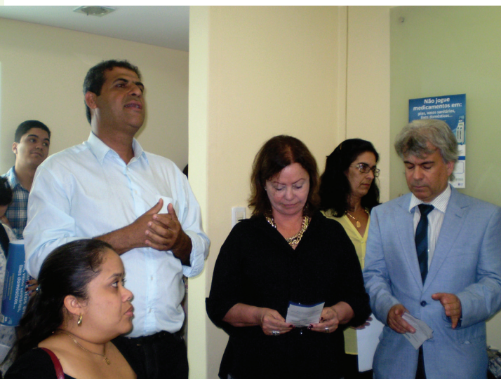
Inauguração da estação coletora de descarte consciente