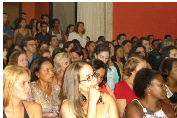
Palestras motivaram a participação de estudantes e profissionais

A diretoria do CRF-BA e a Comissão de Farmácia Comunitária do conselho promoveram curso sobre Técnicas de Injetáveis em vários municípios.