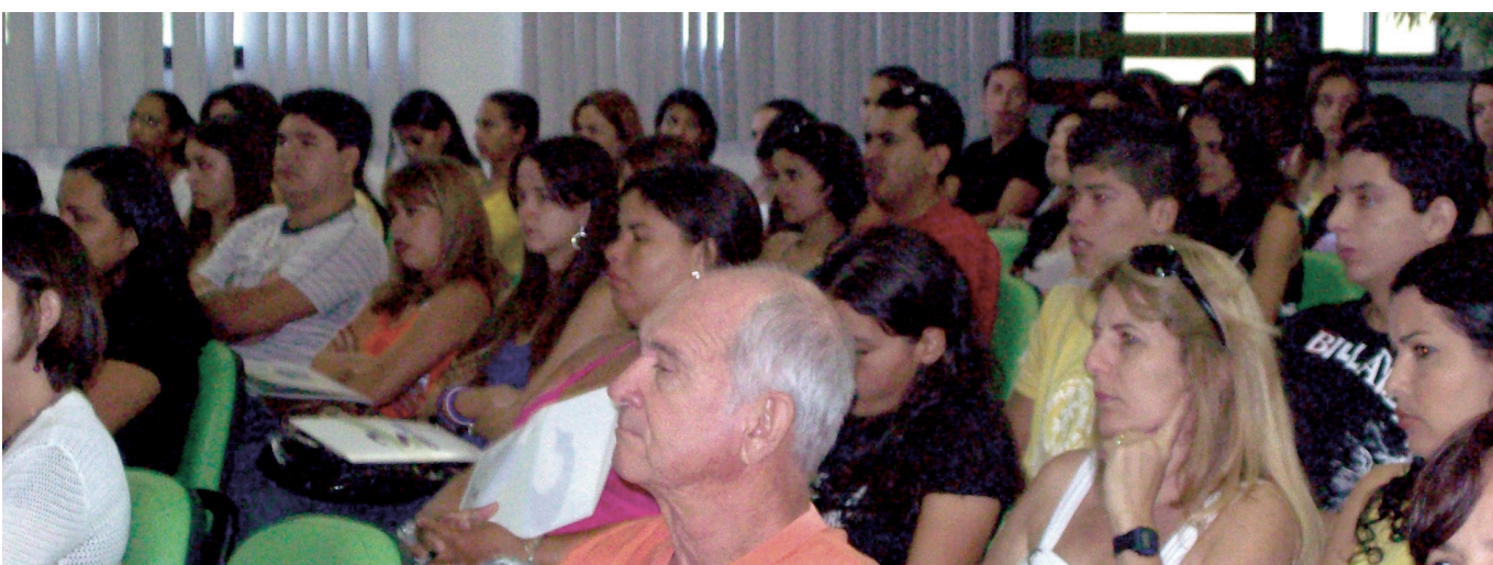
Um grande número de farmacêuticos de Teixeira de Freitas no evento

A ASFARMA de Vitória da Conquista e Região