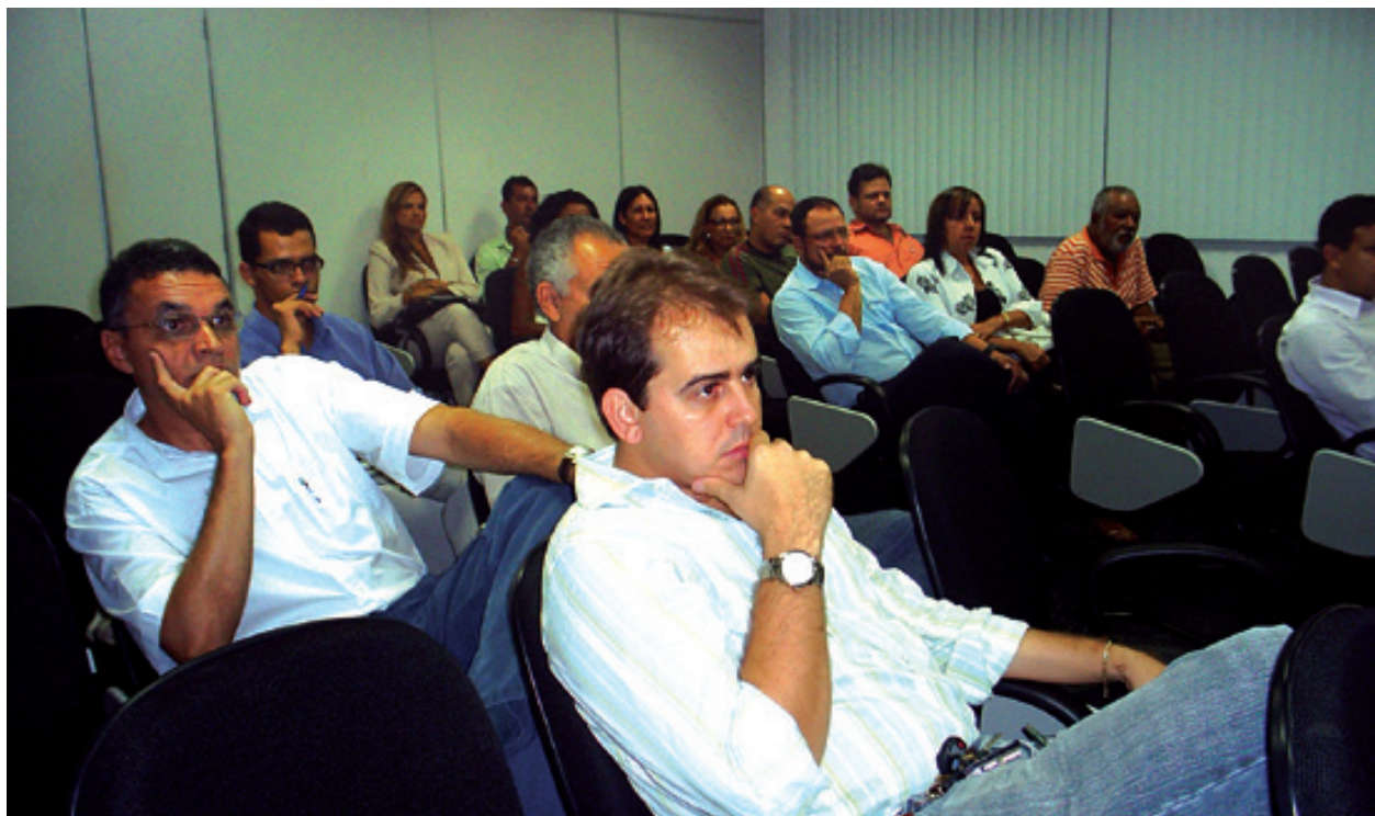
Preços éticos atraíram proprietários de laboratórios clínicos

Em julho, ocorreu em Itabuna uma reunião sobre a proposta de resolução que regulamenta a prescrição farmacêutica, posta em consulta pública pelo CFF. Os presentes trataram também das eleições para a nova diretoria da associação da região.