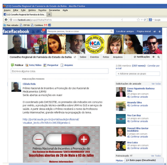
Página no Facebook

ao Farmacêutico foram lançadas no decorrer