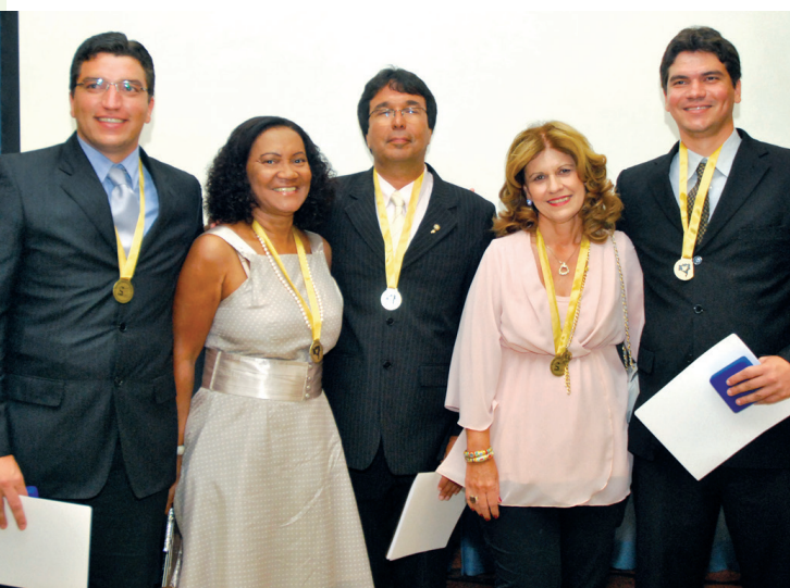
Farmacêuticos de mérito

A Implantação da Fitoterapia no SUS e o Ensino de Farmacognosia foi tema de seminário. Na ocasião, os professores de Farmacognosia recomendaram tópicos que deveriam ser contemplados pelas disciplinas de Farmacognosia dos cursos de Farmácia no Estado da Bahia.