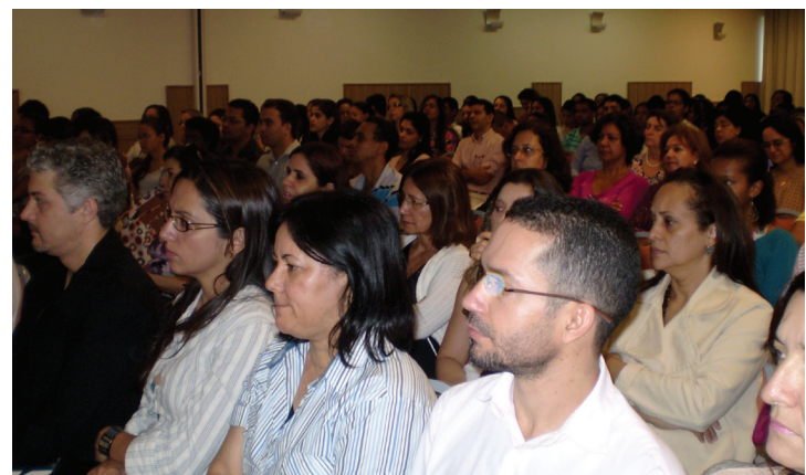
Eventos contaram com a presença de muitos profissionais sobras. Inicialmente foram implantados 10 pontos coleta.

O CRF-BA foi um dos coordenadores do programa sobre o Descarte de resíduos de medicamentos de origem domiciliar. Em dezembro, foi iniciada a coleta amostral de medicamentos em desuso, vencidos ou