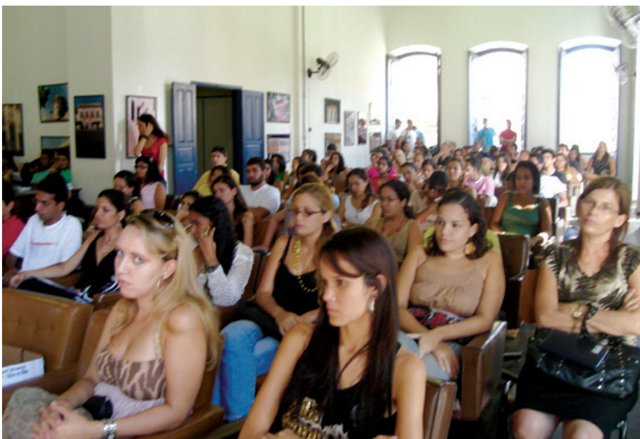
1º Encontro de Farmacêuticos do Recôncavo

Reunião realizada em Jacobina, em julho, abordou a regularização de estabelecimentos farmacêuticos, com a participação do CRF-BA, da ANVISA, das Diretorias Regionais de Saúde (Dires), além de farmacêuticos e proprietários de farmácias.