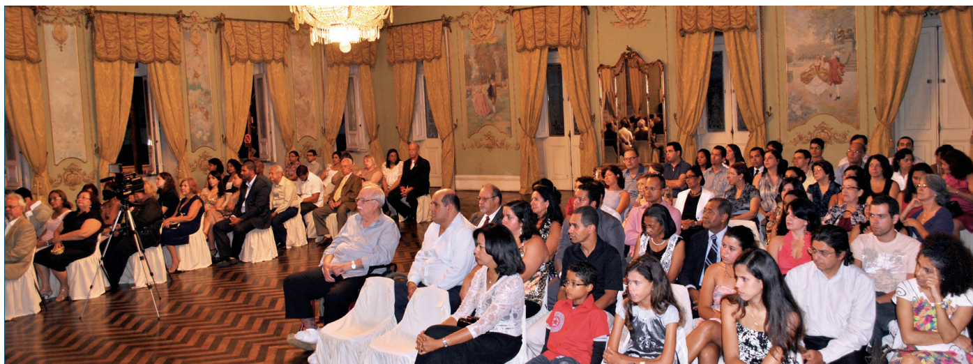
Jubileu de Ouro comemorado no Palácio da Aclamação

A palestra, que contou com o apoio do Conselho Regional de Farmácia da Bahia (CRF-BA), em parceria com a Vigilância Sanitária de Salvador (VISA).