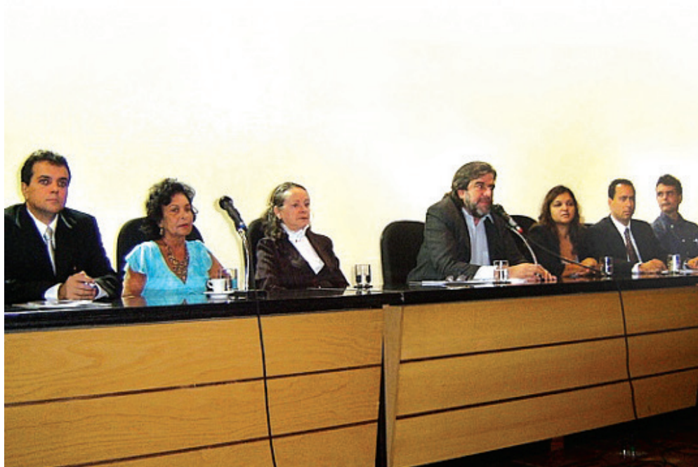
Seminário aborda Assistência Farmacêutica e URM

A qualidade do atendimento, a segurança nas informações, foram dados abordados em palestra sobre Administração de Medicamentos e Aplicação de Injetáveis, em 20 de março, em Salvador. A atividade foi aberta pela diretora do Sindifarma, a farmacêuti-