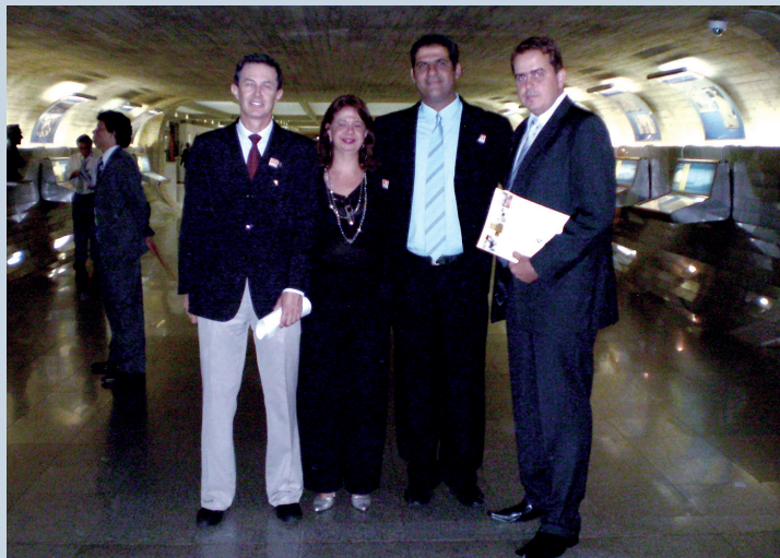
Direção do CRF-BA mobiliza Senhores em defesa da Citopatologia no Congresso Nacional

Profissionais da área de saúde – farmacêuticos, psicólogos, enfermeiros, fisioterapeutas, e muitas outras categorias participaram de manifestações a favor da manutenção dos vetos referentes ao Ato Médico.