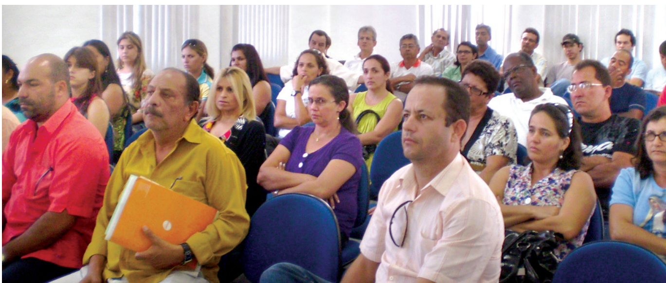
Farmacêuticos de Cícero Dantas atendem a convocação do conselho.