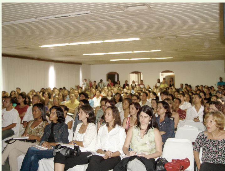
Presença numerosa de farmacêuticos