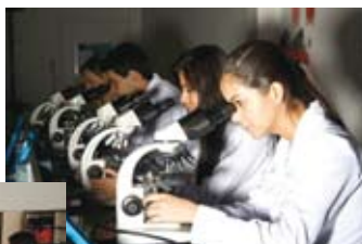
Alunos participam da aula de laboratório