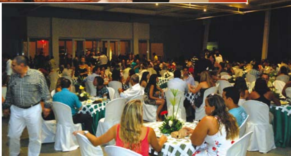
No evento, a participação expressiva dos farmacêuticos, que lotaram todos os espaços do evento

Um dos momentos mais esperados da comemoração é a festa dançante com muitos participantes.