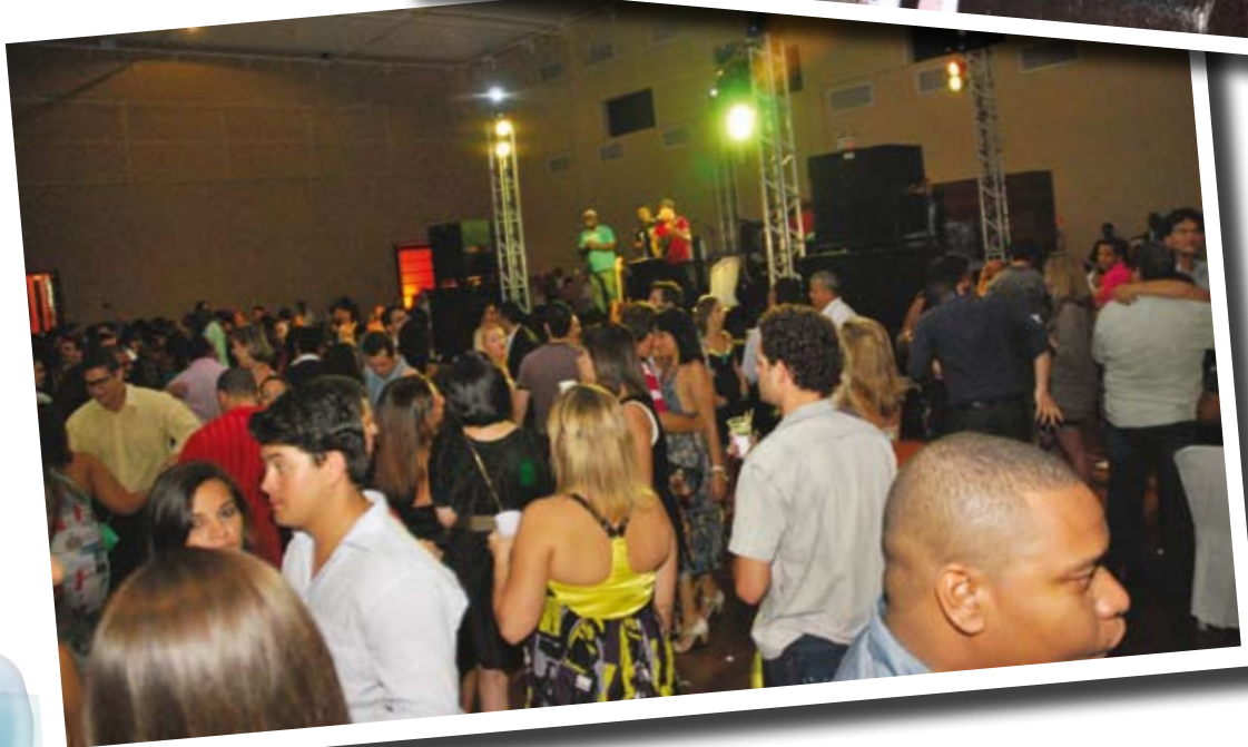
O salão de festa repleto de farmacêuticos e familiares que dançaram ao som da boa música