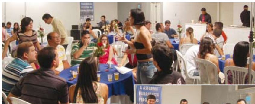
Encontros marcam a Festa dos Farmacêuticos na Bahia

A festa aconteceu na casa do médico, com a presença de 50 convidados e acompanhantes.