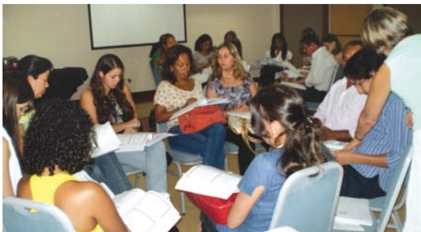
Participantes formam grupos de estudo

características e o tratamento com a farmacoterapia e interações medicamentosas no diabetes.