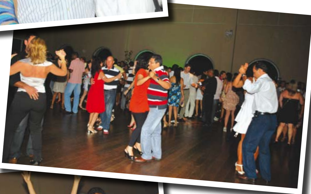
Harmonia, compasso e parceria na dança de salão