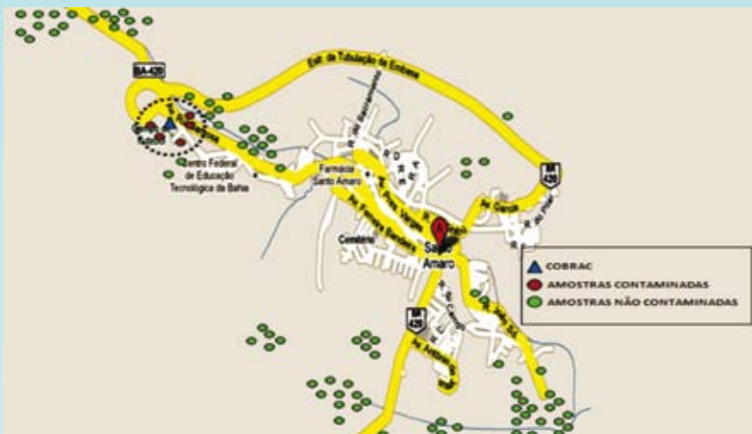
Figura 1. Mapa representativo de Santo Amaro indicando o local de origem das amostras analisadas. Em destaque área de coleta das amostras que apresentaram contaminação.

Observa-se que a contaminação dos alimentos por chumbo no município de Santo Amaro está restrita a área circunvizinha às instalações da antiga fundição de chumbo presente na cidade (Cobrac), indicando que o passivo ambiental presente neste local é fonte atual de contaminação para os alimentos nele produzidos.