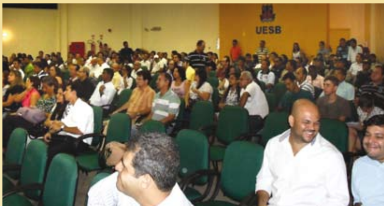
Participantes lotaram o auditório

A Agência Nacional de Vigilância Sanitária tem realizado ações de fiscalização em vários estados e municípios do país. Na cidade de Jequié, em uma ação da ANVISA, foram interditados quatro estabelecimentos farmacêuticos por diversas irregularidades. A partir desta iniciativa da ANVISA, uma reunião foi proposta para esclarecer informações necessárias para o funcionamento de farmácias. O encontro contou com a participação de farmacêuticos e proprietários de farmácias das cidades