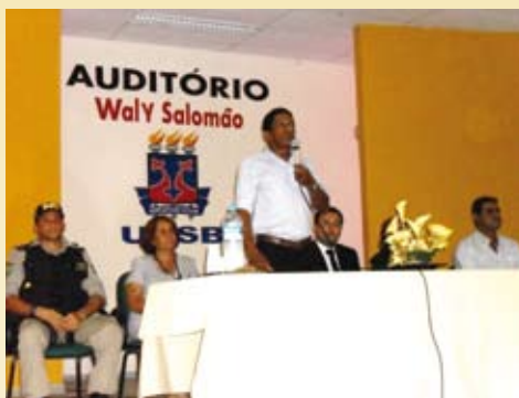
Representação de órgãos da fiscalização

A Agência Nacional de Vigilância Sanitária tem realizado ações de fiscalização em vários estados e municípios do país. Na cidade de Jequié, em uma ação da ANVISA, foram interditados quatro estabelecimentos farmacêuticos por diversas irregularidades. A partir desta iniciativa da ANVISA, uma reunião foi proposta para esclarecer informações necessárias para o funcionamento de farmácias. O encontro contou com a participação de farmacêuticos e proprietários de farmácias das cidades