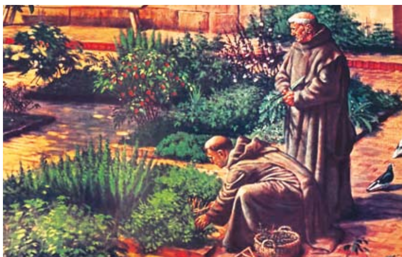
Farmácia monástica, século V-XII (Livro 50 anos CFF - página 16)

Desde a antiguidade, ervas já eram manipuladas para obter a cura das enfermidades. Os boticários surgem por volta do século XIII. Essa profissão surge com a botica. No século XVI, a profissão de boticário inicia-se no Brasil. A botica do Colégio dos Jesuítas da Bahia não fornecia remédios apenas para os outros colégios da Companhia de Jesus, mas atendia às necessidades do povo da cidade do Salvador.