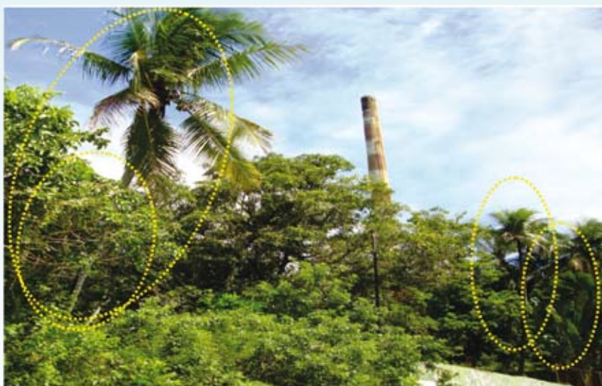
Figura 2. Vista de parte do terreno da Cobrac com chaminé da antiga fábrica ao fundo. Em destaque espécies frutíferas (pitangueiras, bananeiras e coqueiros) presentes nesta área.

espécies frutíferas (Figuras 2) que são consumidas pela população local, sobretudo por crianças e adolescentes. A falta de barreiras físicas eficazes e informações suficientes sobre o perigo desta prática aumentam o risco de contaminação humana por chumbo, já que comprovadamente este terreno abriga considerável parte das 500.000 toneladas de escória de chumbo atualmente presentes no município de Santo Amaro.