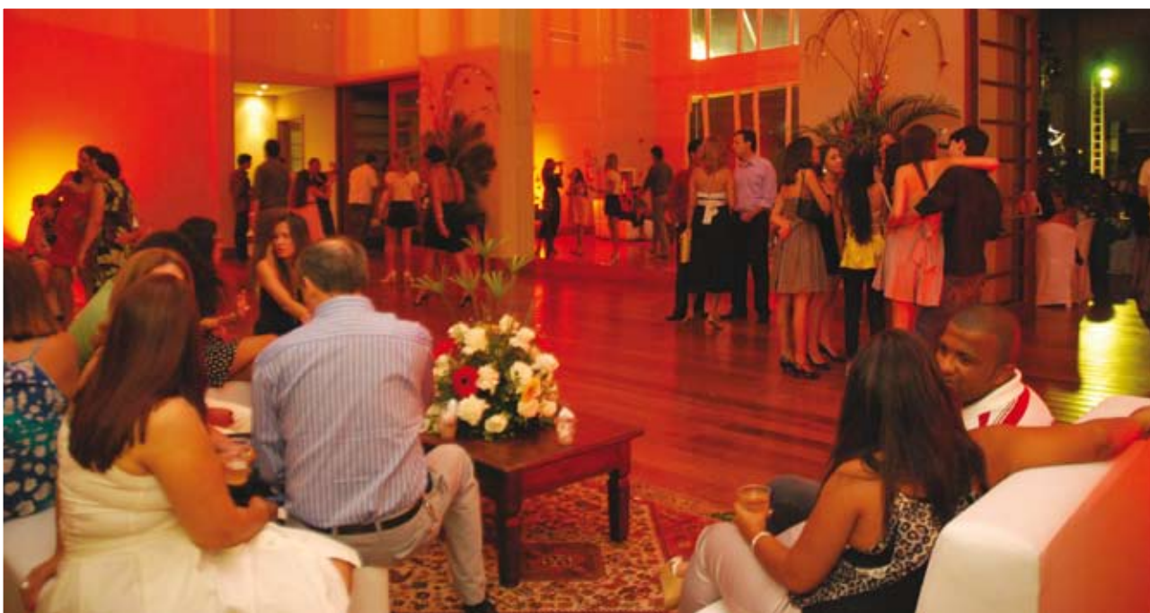
Descontração e bom gosto marcaram a Festa do Farmacêutico

Com cerca de mais de mil participantes, a Festa do Farmacêutico foi um sucesso. No dia 22 de janeiro, na capital baiana, farmacêuticos e estudantes de Farmácia de todo o Estado da Bahia foram comemorar o seu dia