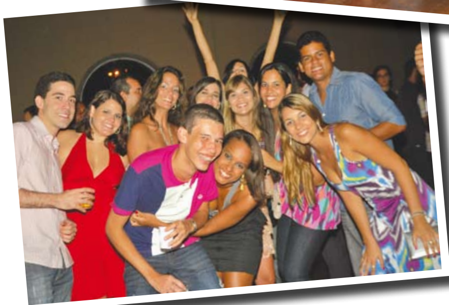
Muita alegria entre os estudantes de Farmácia e os novos farma- cêuticos