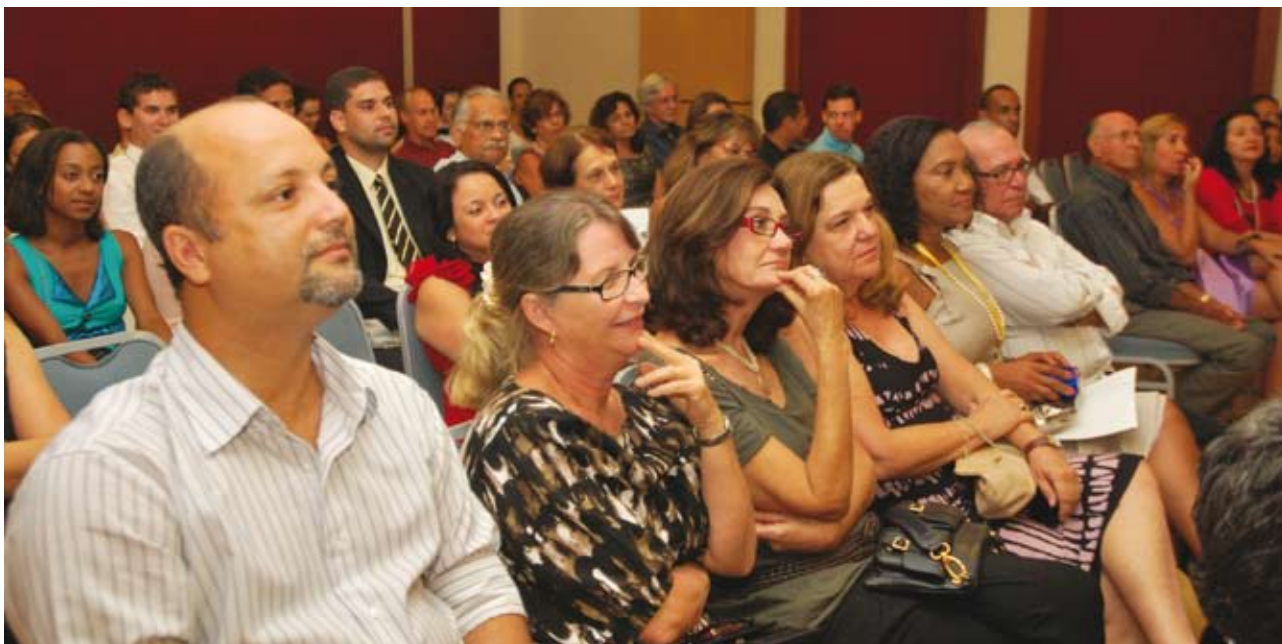
Famíliares, colegas e amigos prestigiam os homenageados

A Direção do Conselho Regional de Farmácia do Estado da Bahia realizou, no dia 17 de janeiro, às 19 horas, no auditório do Hotel Vila Galé, em Ondina, a solenidade comemorativa ao Dia do Farmacêutico, com a entrega das Comendas ao Mérito Farmacêutico. A homenagem é uma honraria concedida aos profissionais farmacêuticos, a autoridades dos poderes da República e aos cidadãos, além